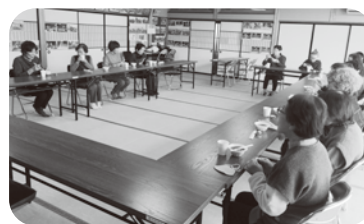
令和7年1月23日 富吉七福会 ~茶話会「手作りぜんざい」~