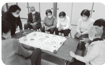
令和7年1月20日 下口七福会 ~お正月遊び「スゴロク」~