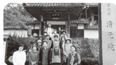
10月24日 富吉七福会 ~琴浦町へお出かけ~

前号の七福会の記事で誤りがありました。ご迷惑をおかけして申し訳ありませんでした。正しい記事を掲載させていただきます。