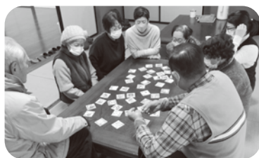
令和7年1月10日 上1七福会 ~お正月遊び「かるた」~