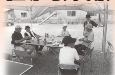
上口2区世代間交流