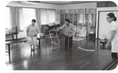
令和6年8月9日 上1七福会 ~ニュースポーツ「モルック」~