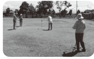
令和6年6月21日 海川七福会 ~海浜公園でグラウンドゴルフ~