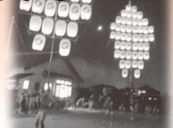
下口といえば万灯