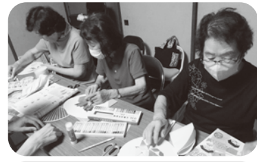
令和6年7月22日 下口七福会 ~物づくり「手作りうちわ」~